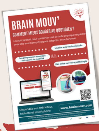
Brochure BRAIN MOUV'

Pour en recevoir , contactez nous à l'adresse mail suivante : contact@brain-team.fr Pour en imprimer , cliquez sur les brochures pour les retrouver en format numérique