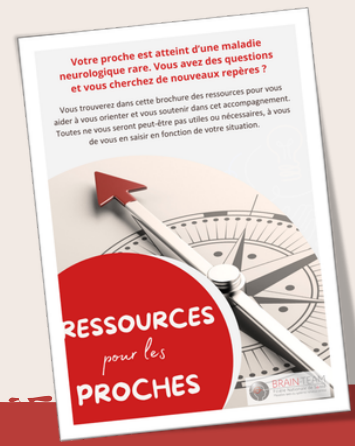
Brochure Ressources pour les proches