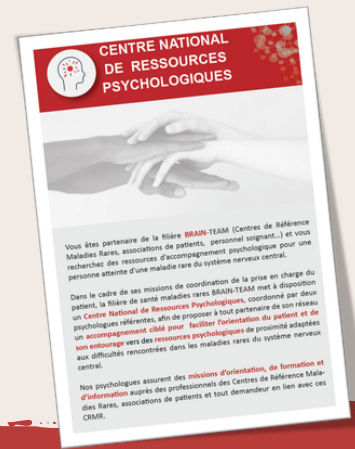
Brochure Centre National de Ressources Psychologiques